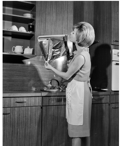
Photographie de l'exposition