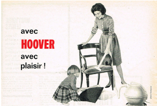
Publicité des années 60

Trouve un point commun et une différence entre ces deux images :