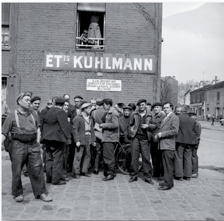
Groupe de travailleurs devant un site Kuhlmann en 1959.

Dans cette perspective, nous allons lancer une campagne pour recueillir des ressources documentaires inédites - archives familiales, archives d'entreprise, témoignages, photos, etc., qui contribueront à renouveler l'approche de cette histoire disparue. Grâce à l'utilisation des médias en ligne, les participants à cette aventure pourront dialoguer avec les historiens et les spécialistes du patrimoine mobilisés sur ce projet.