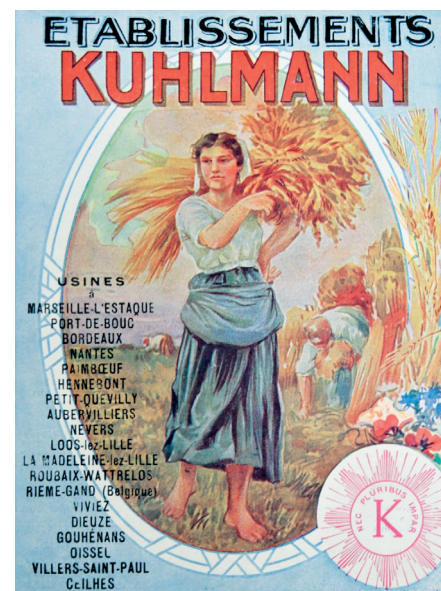
Affiche début XX e siècle

Pour atteindre ces objectifs, le projet repose sur une démarche visant à réunir des ressources documentaires inédites en allant à la rencontre des différents acteurs. Il s'agit de recueillir des témoignages et des documents auprès de la famille, des anciens des Établissements Kuhlmann, de la Compagnie Française des Matières colorantes, des filiales du groupe et de tous ceux qui ont connu l'entreprise (*).