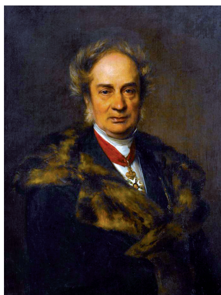
Frédéric Kuhlmann par Franz Xaver Winterhalter. Coll. Palais des beaux-arts de Lille

De l'éminent chimiste à la multinationale française